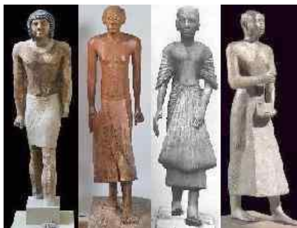
Παλιό Μέσο Νέο Αργά Βασίλειο Βασίλειο Βασίλειο Περίοδος

Ο άντρας ντύνονταν με κοντή μπροστέλα . Φορούσε βραχιόλι, δαχτυλίδι και έδενε στο λαιμό περιδέραιο με 5-6 σειρές μαργαριτάρι. Μερικοί φορούσαν χιτώνες ως τον αστράγαλο, ίσιους και χωρίς ιδιαίτερα στολίδια. Κάποιοι προτιμούσαν πτυχωτό χιτώνα από λινό, που άφηνε ελεύθερο το λαιμό, ήταν εφαρμοστός στον κορμό και φαρδύς κάτω. Από πάνω έδεναν φαρδιά ζώνη που αποτελούνταν από πτυχωτή εσάρπα, τα άκρα της οποίας είχαν τριγωνικό σχήμα